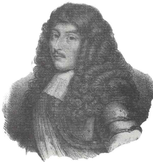
Le Grand Condé.