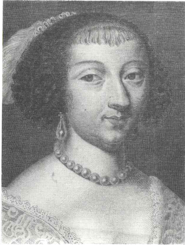
LOUISE D'ORLEANS, DUCHESSE DE MONTPENSIER