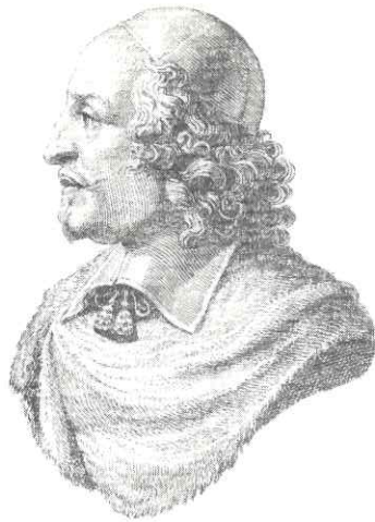
LE CARDINAL MAZARIN.

Imprimé à la Bibliothèque Municipale de Lille 4 ème Trimestre 1995