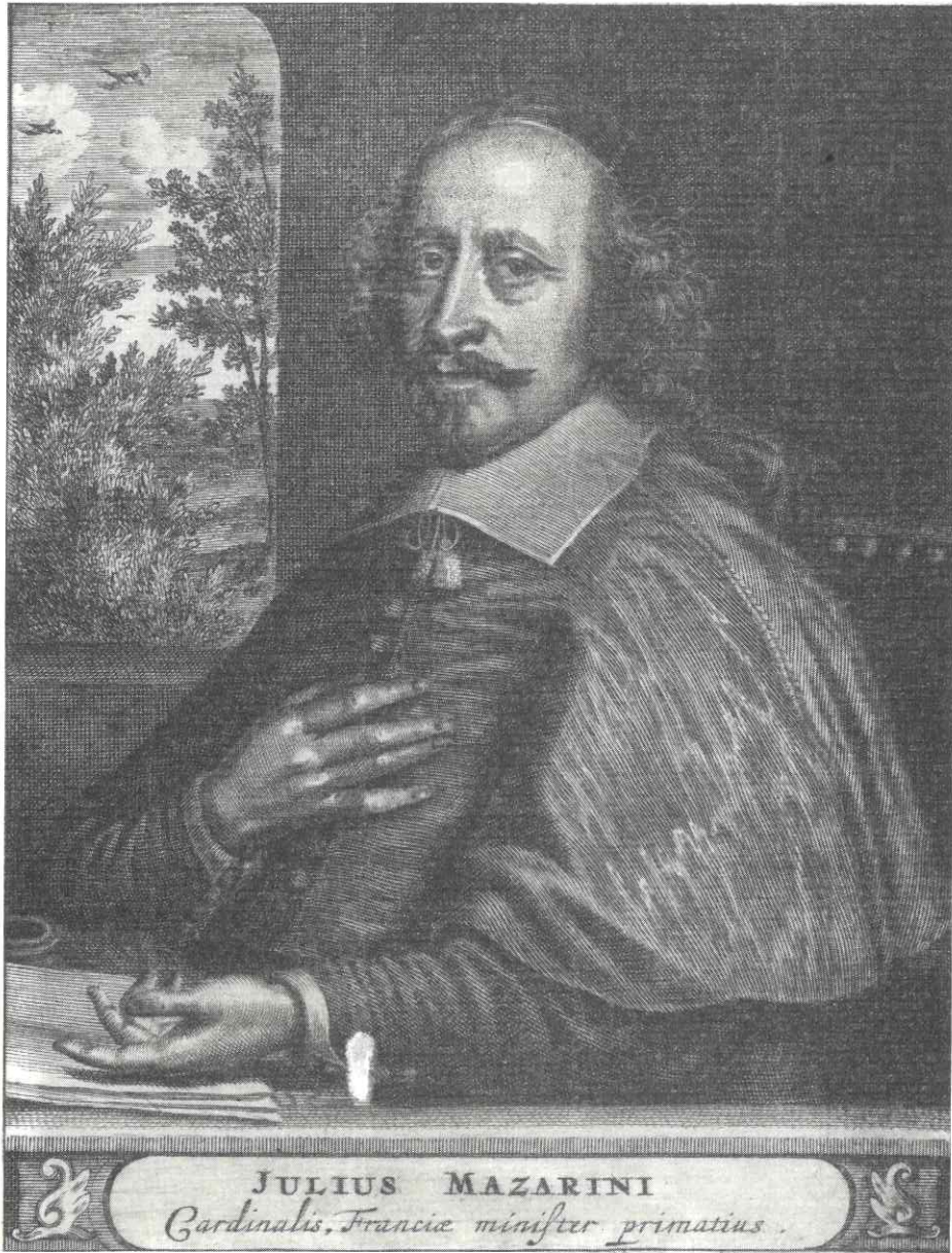
JULIUS MAZARINI Cardinalis, Francie minister primatius.